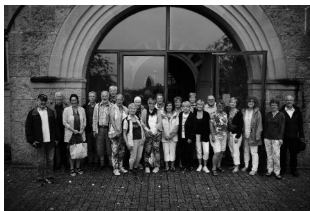
Bild: Start der Kirchgemeindereise ins Piemont