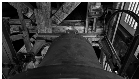
Bild: Glockenstuhl Salmstach

Zudem möchten wir unsere Grünflächen noch naturnaher bewirtschaften. Mehr Blumen, mehr Insekten.