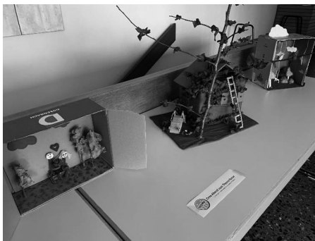
Bild: Creativ-Abend im Teenietreff zum Thema Natur.

Im Bereich Jugend erfreut sich seit einiger Zeit der Teenietreff grosser Beliebtheit. Die Jugendlichen freuen sich nach den Kontakteinschränkungen durch dieses unbeliebte Virus, sich nun wieder frei treffen zu können, um gemeinsam etwas sinngebendes zu erleben.