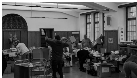
Bild: Viele fleissige Hände packen hunderte Pakete für die Aktion Weihnachtspäckli.

Der Bazar der Kreativen Frauen, mit Unterstützung durch die Landfrauen Romanshorn-Salmsach, fand wiederum an zwei Tagen (Ende November) im Kirchengemeindehaus statt. Die selbsthergestellten Produkte fanden zahlreiche Abnehmer:innen. Mit dem Erlös von CHF 16'000 konnten insgesamt 20 Institutionen, Organisationen und karitative Einrichtungen (z.B. Jubla, CEVI, Plussport, Tischlein deck dich, Spiel dich durch Romanshorn, Oase Amriswil, Food for the Hungry, usw.) unterstützt werden.